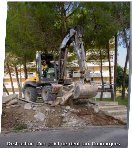
Destruction d'un point de deal aux Canourgues