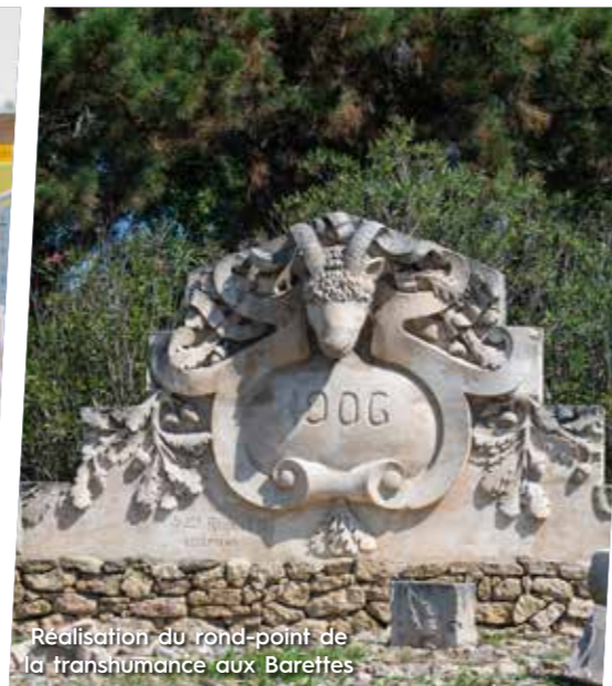
Réalisation du rond-point de la transhumance aux Barettes