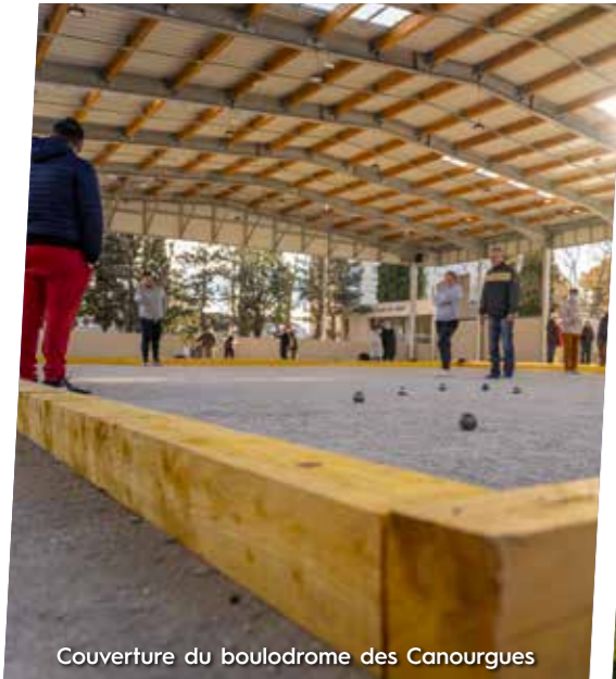
Couverture du boulodrome des Canourgues