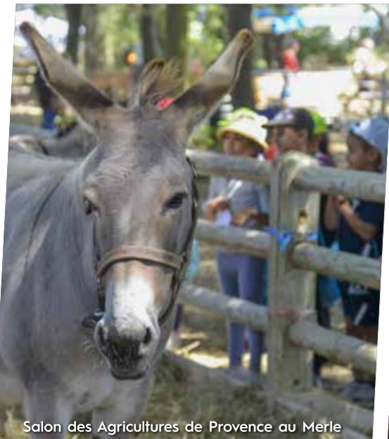
Salon des Agricultures de Provence au Merle