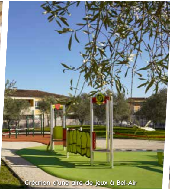
Création d'une aire de jeux à Bel-Air