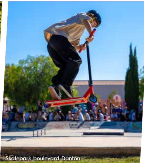
Skatepark boulevard Danton