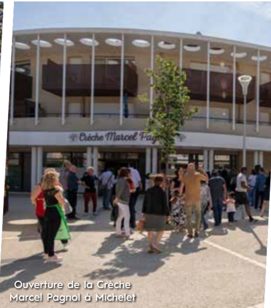
Ouverture de la Crèche Marcel Pagnol à Michelet