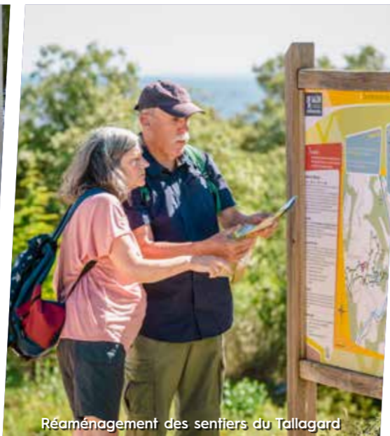
Réaménagement des sentiers du Tallagard