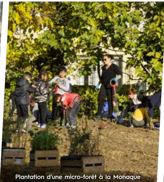
Plantation d'une micro-forêt à la Monaque