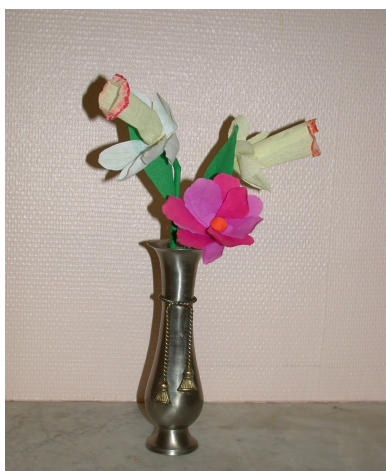
Fleurs en papier crépon

Dans cette maison de Salon qu'il habita près de vingt ans et dans laquelle il mourut, après avoir eu 6 enfants, il écrivit aussi : un traité des hiéroglyphes Orus Apollo et La Paraphrase de Galien .